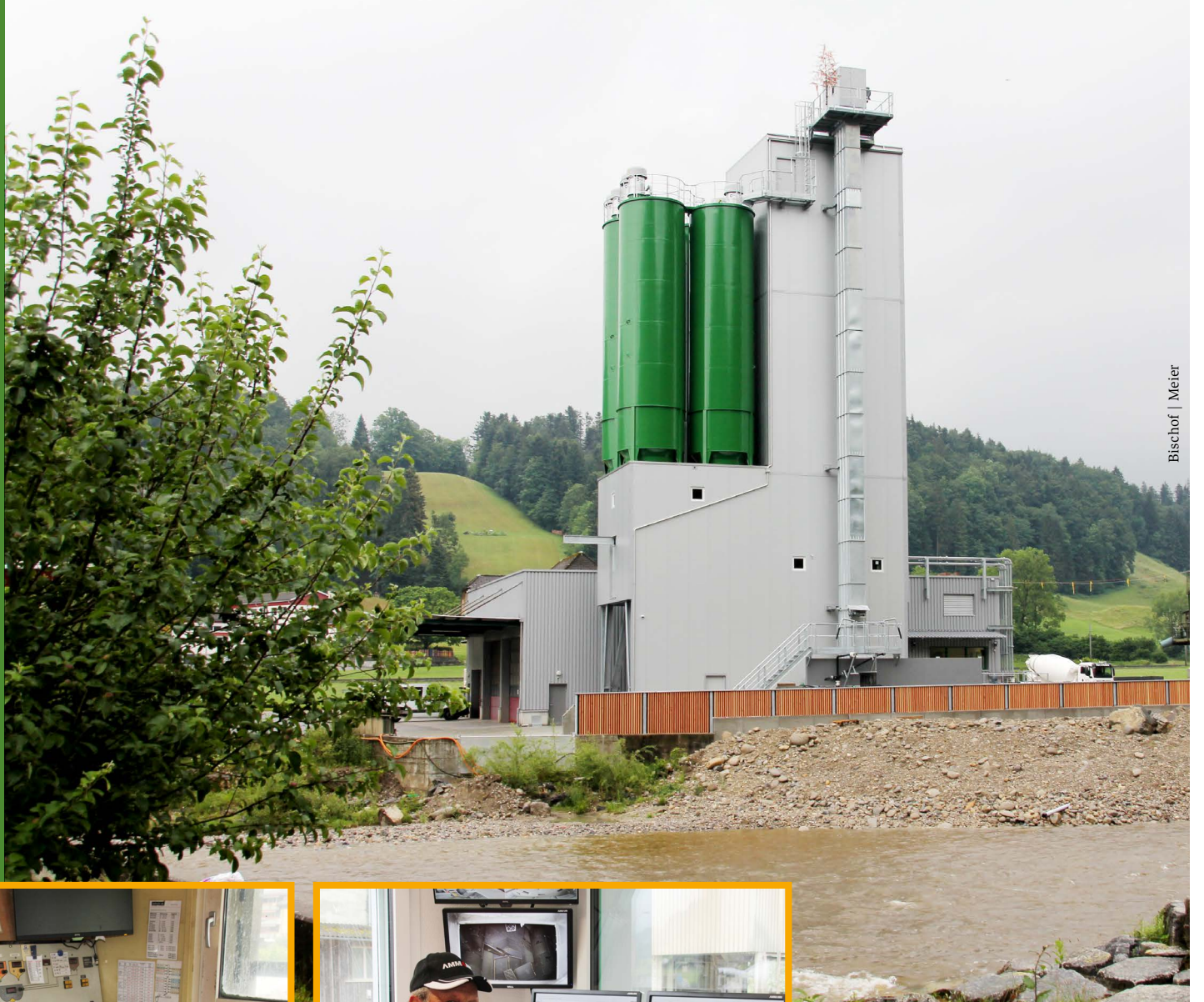
Bischof | Meier

Das Betonwerk der Imbach AG in Wolhusen (Gemeinde Werthenstein) wird Schritt um Schritt erneuert. Soeben ist das Herzstück in Betrieb genommen worden: der multifunktionale Betonturm. Dank ausgeklügelter Technologie können verschiedenste Betonsorten hergestellt werden. Beton ist für die Bauwirtschaft der wichtigste, unverzichtbarste Baustoff. Er soll auch künftig für Bauprojekte in der Region in der gewünschten Quantität und Qualität geliefert werden.